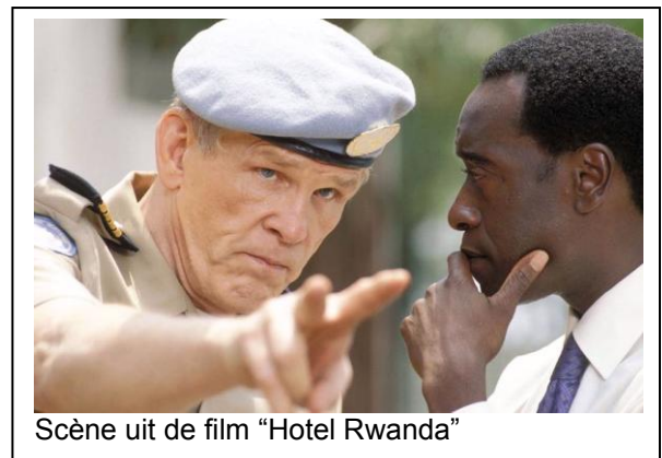
Scène uit de film "Hotel Rwanda"

Deze bemiddeling werkte echter niet veel uit. Zoals gezegd draaide minister Claes 180 graden om nadat het nieuws van de moord op de 10 Belgische para's bekend raakte. Dezelfde 'publieke opinie' werd nu ingeroepen als argument om de Belgen terug te halen. 8 "Het publiek dat in februari nog de passiviteit t.a.v. de genocide niet zou hebben aanvaard, en die een dag tevoren niet zou hebben aanvaard dat de MINUAR zich zou verschuilen achter zijn beperkte mandaat, als hij met talloze doden zou worden geconfronteerd, zou